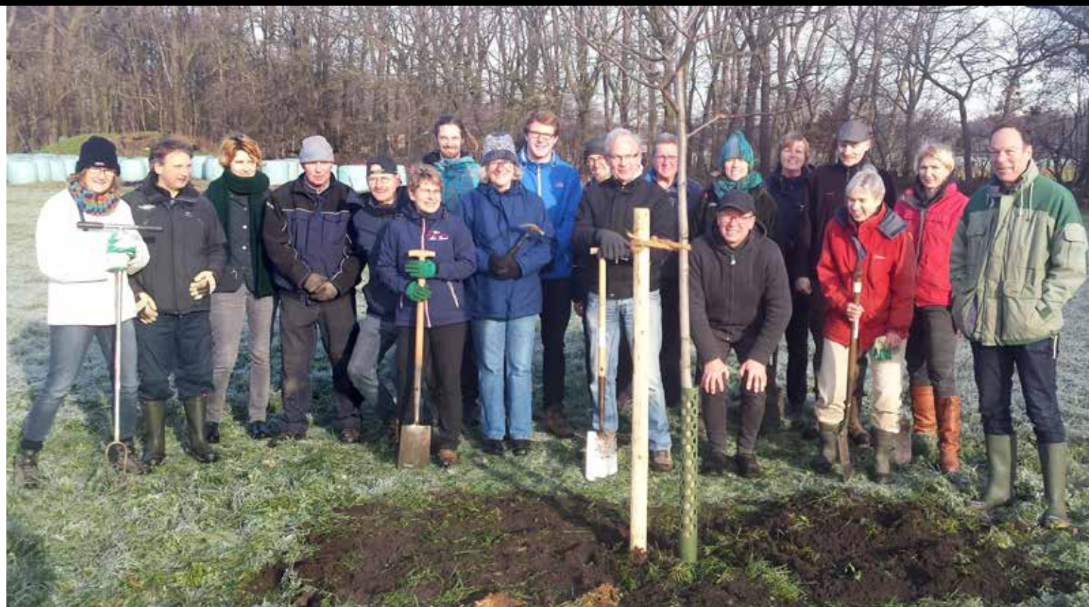
Werkdag vrijwilligers De Groote Stroe, een van de pilotbedrijven, winter 2019.

werkgroepjes. Met ook hier eenzelfde omslag in het denken: de vrijwilligers zijn geen onderhoudsploeg van SLG maar een groep die bij het bedrijf hoort: een zogenaemde 'streekkring'. Het lijkt veel vrijwilligers overigens niet uit te maken: veel vrijwilligers willen vooral graag praktisch aan de slag: 'lekker zagen' of bijvoorbeeld gastvrouw zijn op een lammetjesdag. Toen de boerin van één van de pilotbedrijven als aftrap voor de nieuwe groenploeg begon met het bedrijfsverhaal, was een reactie: "Laat het verhaal maar zitten, ik wil lekker snoeien!" Goede feedback voor het project: het heeft tijd nodig om te zien of verschillende typen vrijwilligers als streekkring kunnen gaan werken.